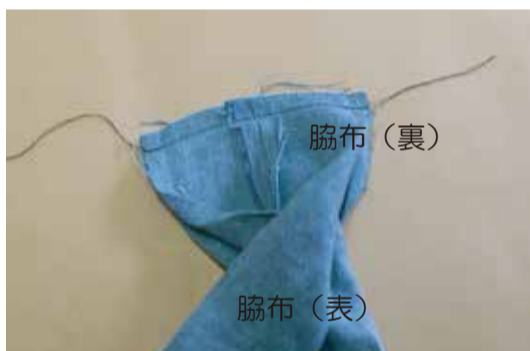
(7) 表に返して手紐の部分も中表に合わせて縫う