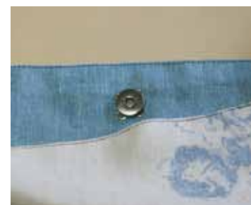
(11) 手付けのマグホックを付けて出来上がり!

※パイピング用の革テープは、両側から3mmの位置に、ハンドステッチ用の穴を目打ちなどで開けておく