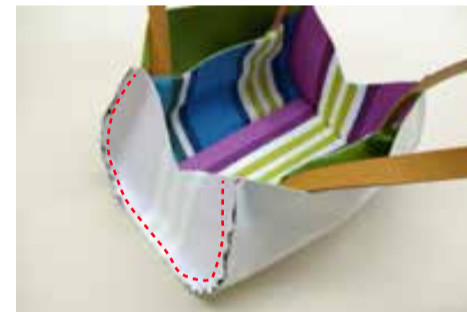
⑤ 本体と脇布を縫う (両側) ④と脇布を中表に合わせて縫う