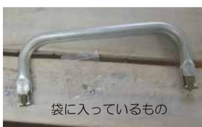
袋に入っているもの