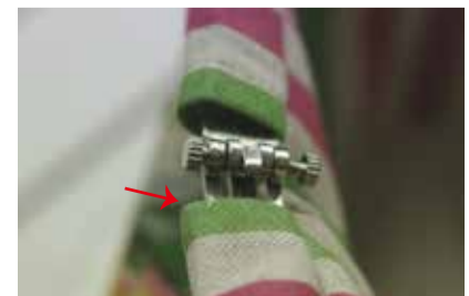
⑦ 短いネジを内側から入れ止める (反対側のネジも⑤、⑥の手順で止める)