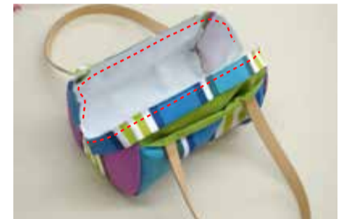
⑦ 口布を仮止めする (両側) 口布を本体に仮止めする