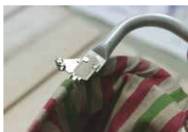
④ もう一方の金具を入れる