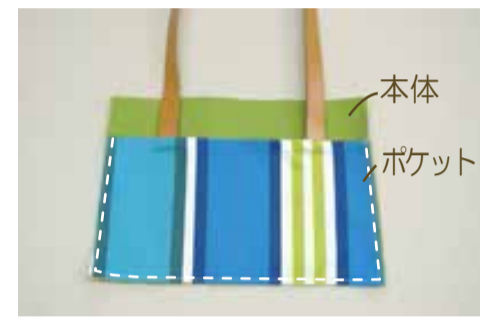
③ ポケットを本体に仮止めする (2組) 本体表に②のポケットを重ね3辺を仮止めする