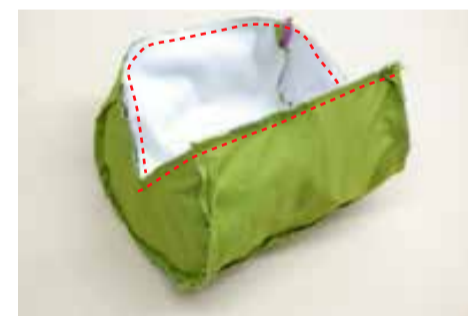
⑧ 口を縫う 本体と裏地を中表に合わせて口を縫う