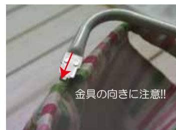
金具の向きに注意!!