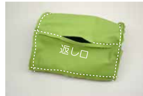
⑥ 裏地を縫う ④・⑤の手順で裏地を縫う (底に返し口をあけておく)