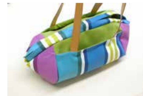
⑨ 表に返し返し口を縫う ⑨-1 表に返し、口を出来上りに折る ⑨-2 返し口を縫う