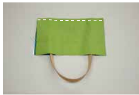
②-2 ポケットの表地と裏地を中表に合わせて口を縫い表に返す