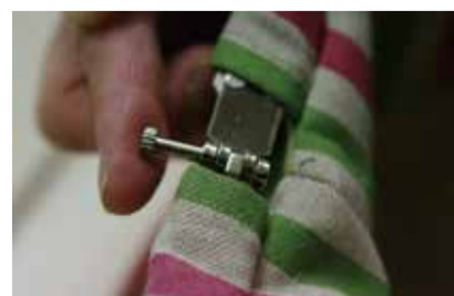
⑥ 長いネジを外側から入れる