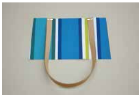
② ポケットを作る (2組) ②-1 ポケットに手紐を仮止めする