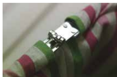
⑤ つなぎ目がまっすぐになるように金具をあわせる