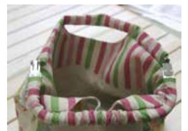
① ニュームカンについているネジをはずす (両側) ② 口布にニュームカンを通す ③ 片方の金具が通ったところ