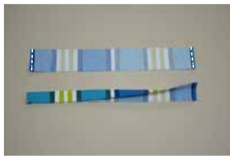
① 口布を作る (2組) 口布の脇を出来上がりに折りステッチして、半分に折る

※ (芯を貼ります) の表記は接着芯を貼る場合の目安です。 生地 の 厚 さ や お 好 み に よ り、 貼 ら な く て も お 作 り 頂 け ま す 接着芯を使用する場合は、表地と同じ大きさに裁断して表地の裏に貼ります