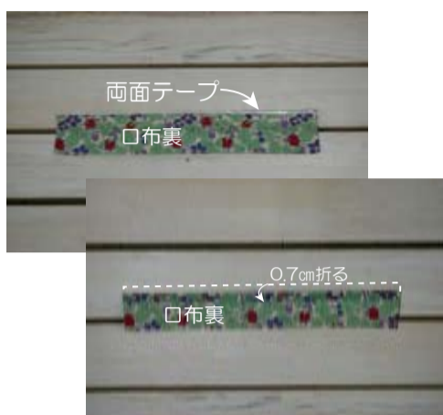
(2) 上マチのファスナー付け位置の端に両面テープを付け、出来上がりで折る