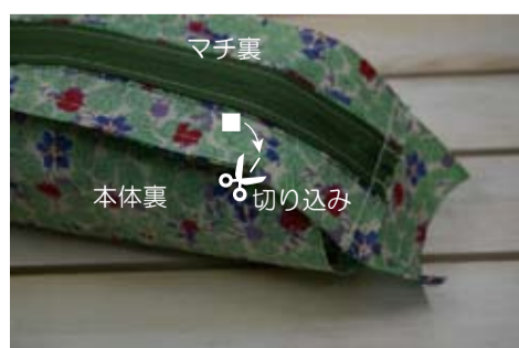
(10) 上マチの■の縫い代に切り込みを入れる(4ヶ所)