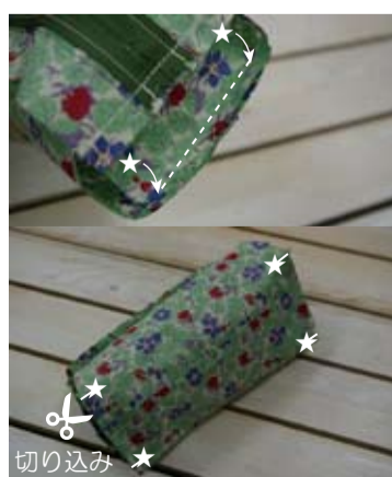
(11) 底と下マチを中表に合わせて★～★まで縫い、本体底の★の縫い代に切り込みを入れる(4ヶ所)