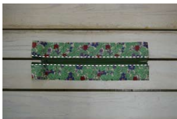
(4) ファスナー付け位置端に表からステッチをする(両側)