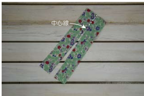
(1) 上マチを中心線でカットする