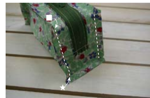
(12) 脇を■～★まで中表に合わせて縫う(4ヶ所)