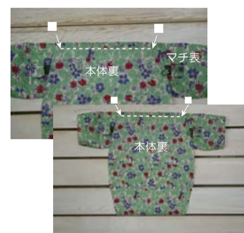
(9) 本体と上マチを中表に合わせて■～■まで縫う(両側)