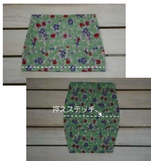
(8) 本体の底を縫い、縫い代は片側に倒し押えステッチをする