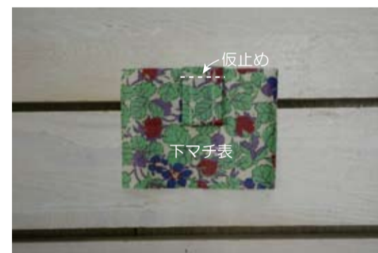
(6) タブを折山で折り、下マチのタブ付け位置に仮止める(両側)