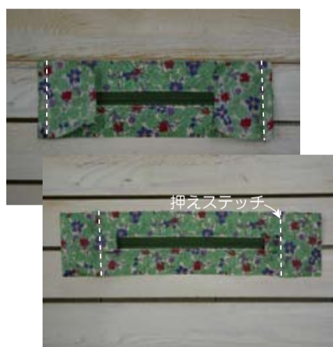
(7) 上マチと下マチを中表に合わせて縫い、下マチ側に縫い代を倒し押えステッチをする(両側) ※(ファスナーは開けておく)