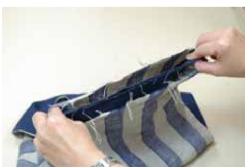
⑧もう片方の脇を中表 に合わせる