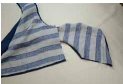
(脇を引き出した状態)