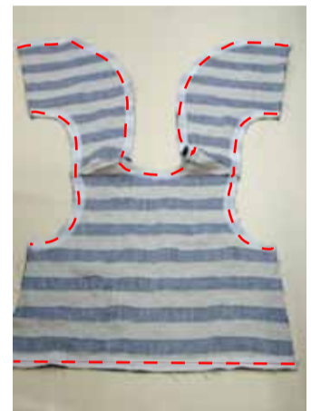
③表地、裏地を中表に合わせて 衿ぐりから前端、袖ぐり 裾を縫う