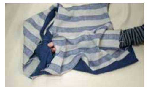
⑥片方の脇から手を入れ 反対の脇を引き出す