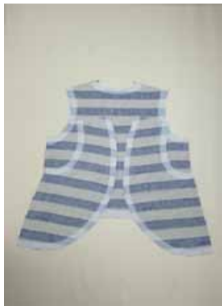
①表地の裏側の衿ぐり、袖ぐり、 前端、裾に芯を貼る