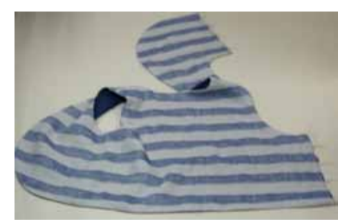
(縫い終わり表にした状態)