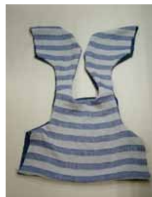
⑤出来上がりにアイロン をかけ、表に返す