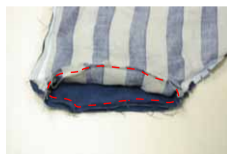
⑦⑥で引き出した脇を中表になる 様に合わせ縫う(表地は表地 どうし裏地は裏どうし)