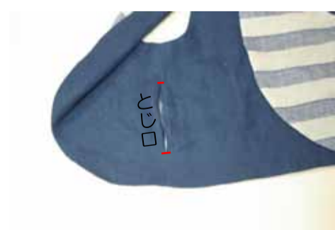
⑨⑧で合わせた脇を、裏地側 にとじ口を縫い残し縫う