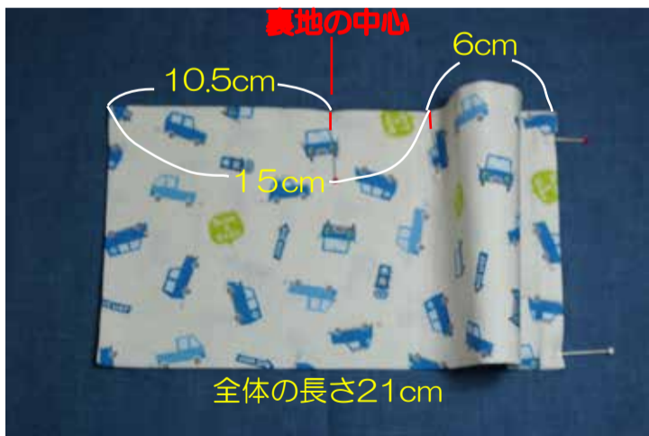
⑤写真の数字を参考にまち針で止める