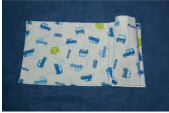
タックありポケット