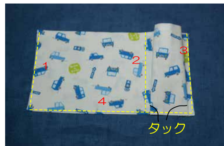
⑥1・2・3を縫い下部4はタックを折り縫う