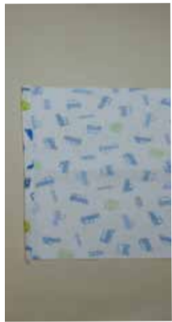
①片側の脇を1cm巾にアイロンで折る