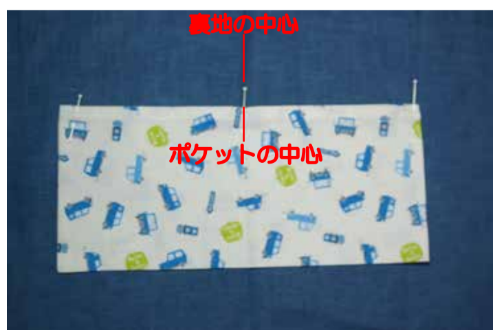
⑦裏地の中心とポケットの中心をまち針で止める