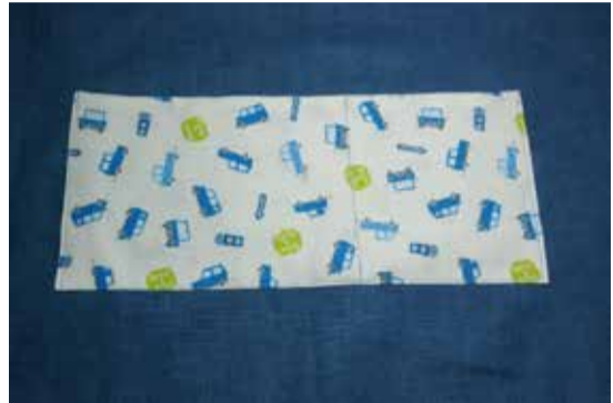
タックなしポケット